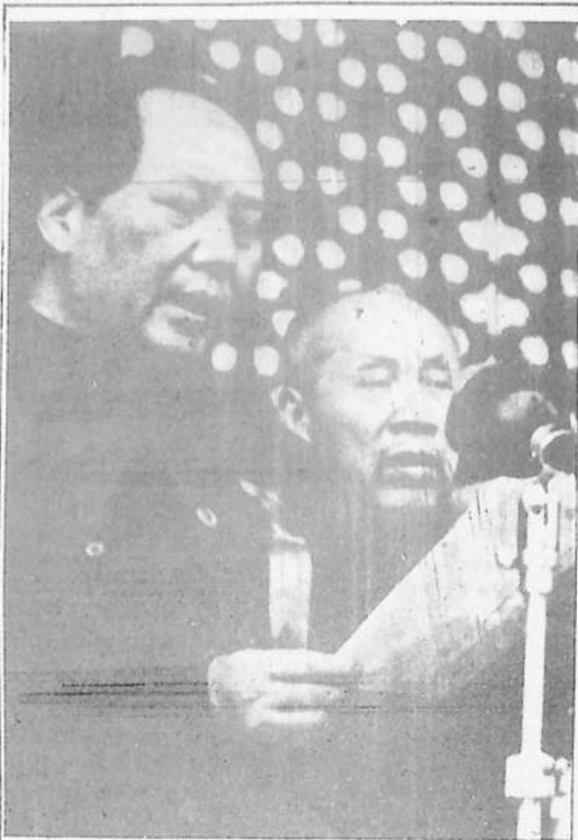
Il compagno Mao Tsetung e il compagno Tung Pi-wu, durante la proclamazione della Repubblica Popolare Cinese il 1° Ottobre 1949.

Annuncio doloroso della morte del compagno Tung Pi-wu fatto dal Comitato Centrale del Partito Comunista Cinese, dal Comitato Permanente dell'Assemblea nazionale del Popolo e dal Consiglio di Stato.