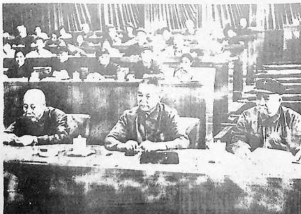
24-28 AGOSTO 1973: X Congresso del Partito Comunista Cinese, il compagno Tung Pi-wu con i compagni Li Sien-nien e Hsin Che-yeou, membri della presidenza del Congresso e membri dell'Ufficio Politico del Comitato Centrale.

La delegazione dell'Organizzazione dei Comunisti marxisti-leninisti d'Italia parteciperà alle onoranze funebri del compagno Tung Pi-wu.