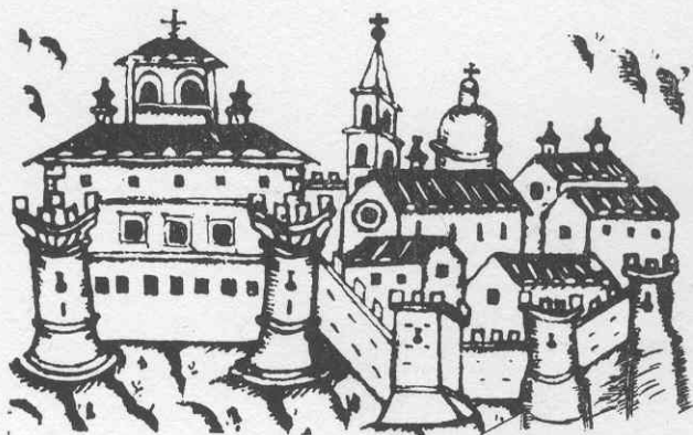
Una veduta di Torremaggiore nel sec. XVII. (Dalle carte dell'Archivio di Stato di Foggia).

È ben noto a quanti seguono dal punto di vista storico le vicende delle trasformazioni politiche, l'influenza esercitata dalla pietà mariana, a preservazione da minacciate sventure, a ripresa di prosperità e di ordine sociale, a testimonianza di spirituali vittorie ottenute". (Giovanni XXIII).