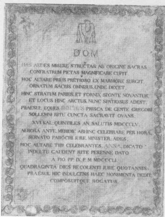
La lapide con i distici di Mons. De Gregorio. (V. pag. 76).