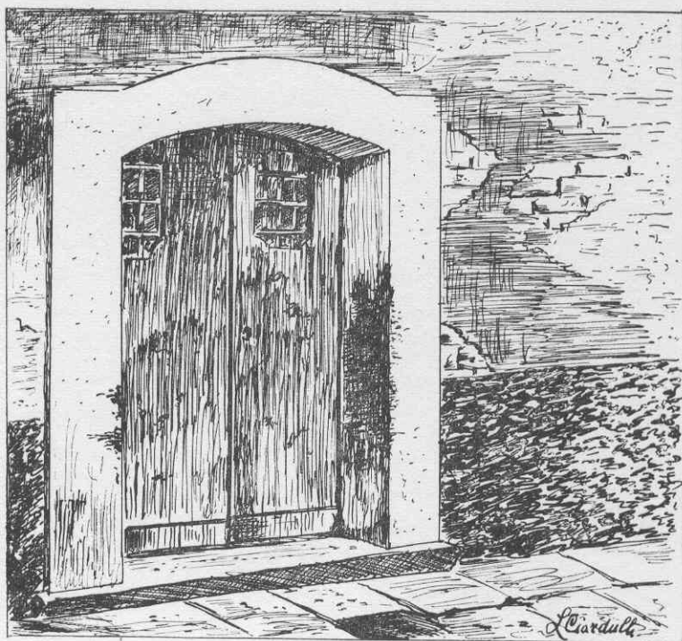
LUIGI CIARDULLI: L'oratorio della Congregazione del SS.mo Rosario, oggi adibito a forno. (vd. pag. 48).