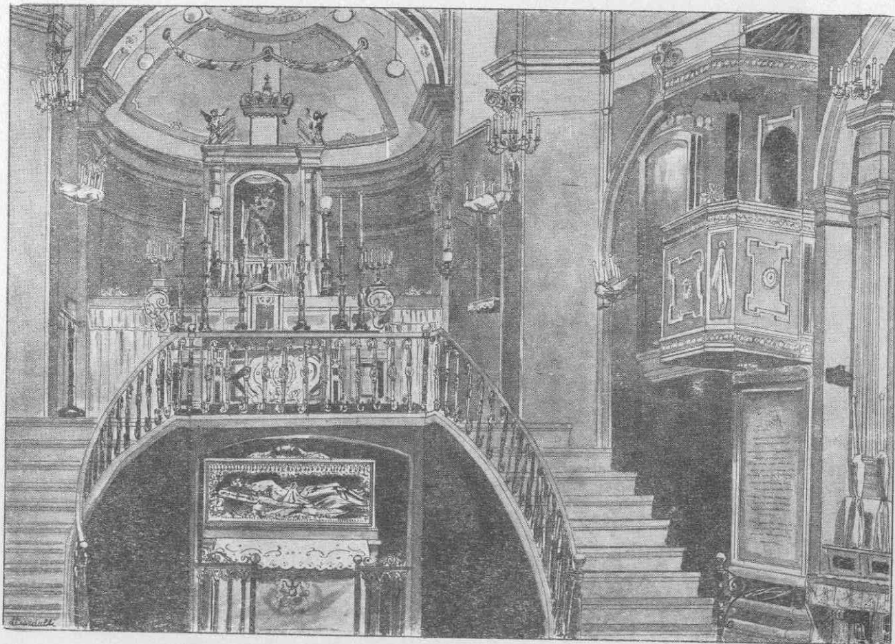
L'interno della Chiesa di Sant'Anna. Lavis di Luigi Ciardulli (Vd. pagg. 97 e 98).