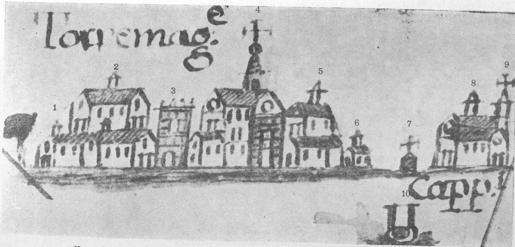
Una veduta di Torremaggiore durante il secolo XVII. Prospettiva su pergamena conservata nell'Archivio di Stato di Foggia. Da sinistra a destra: 1) Chiesa di S. Antonio Abate. 2) Palazzo ducale 3) Porta del Principe. 4) Chiesa Matrice. 5) Parrocchiale di S. Maria. 6) S. Maria dell'Arco (della Fontana. 7) Croce del Convento dei Cappuccini. 8) Il Convento dei Cappuccini. 9) Chiesa rurale di S. Sabino. 10) In primo piano: il Pozzo dei Monaci.