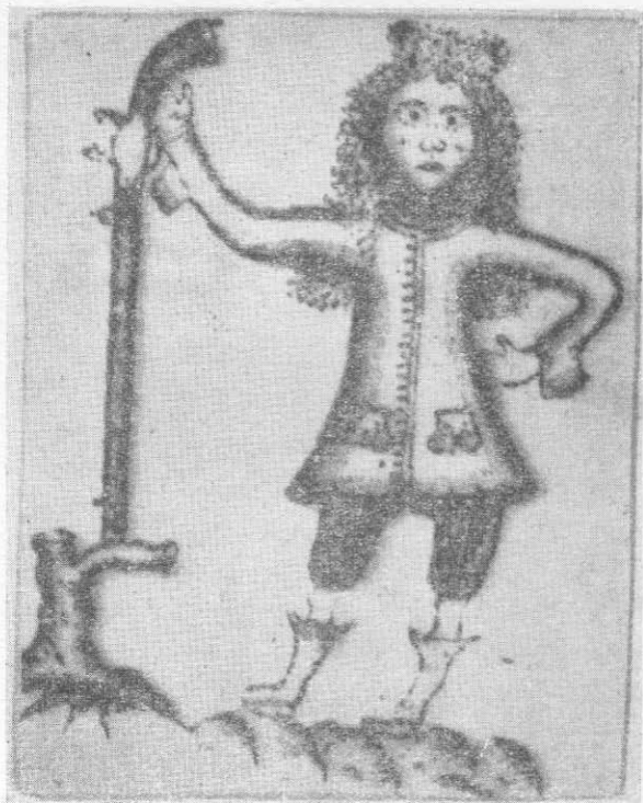
Costume di cacciatore torremaggiorese del sec. XVII (dalle carte della Dogana di Foggia).