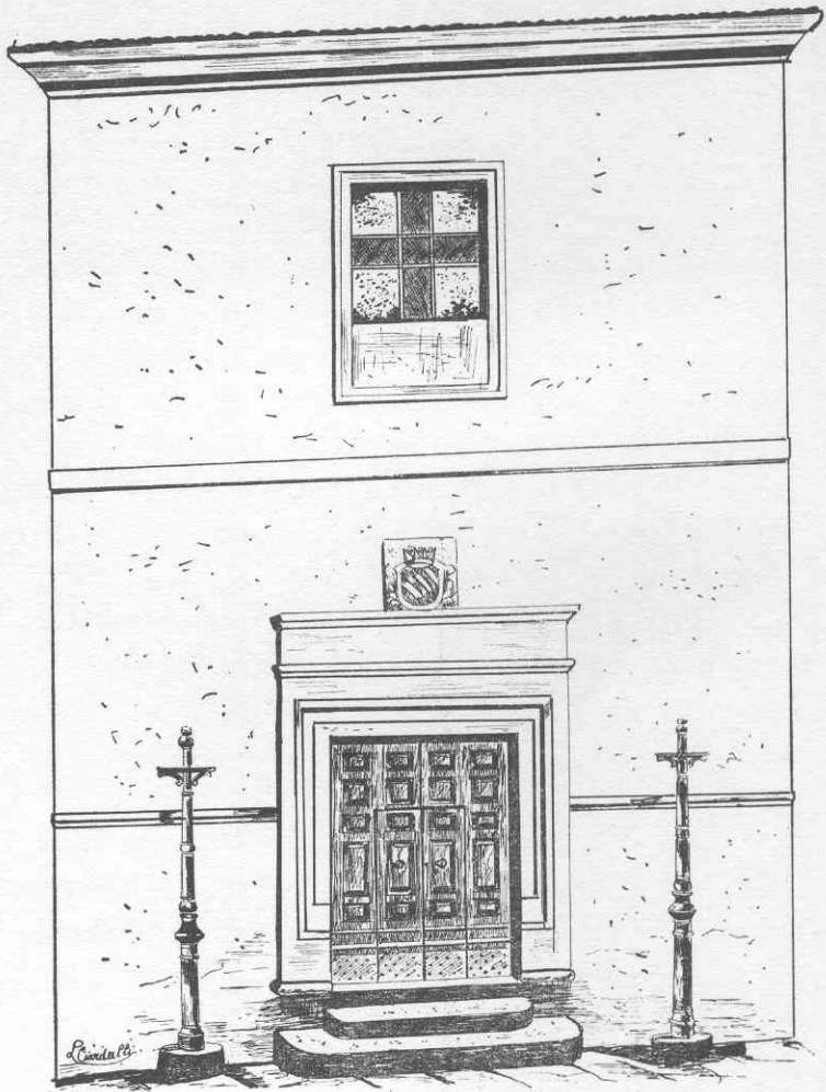
LUIGI CIARDULLI: Prospetto principale della Chiesa di Sant'Anna in Torremaggiore, sede della Confraternita del SS. Rosario.