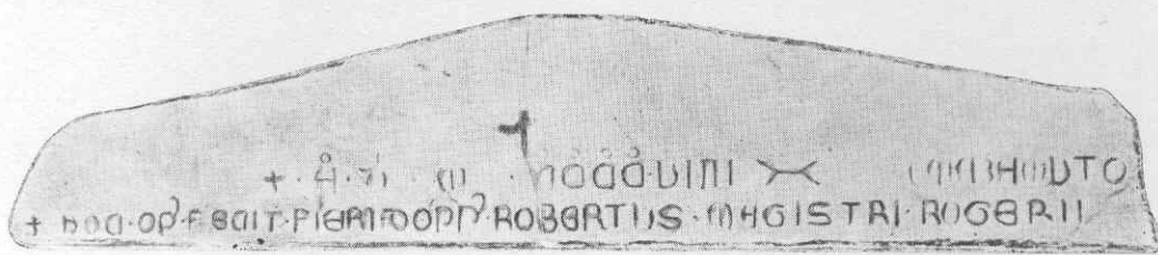
L'architrave di pietra calcarea di Giovinazzo che trovasi nella Chiesa Matrice di S. Nicola (vd. pagg. 35, 36, 37).