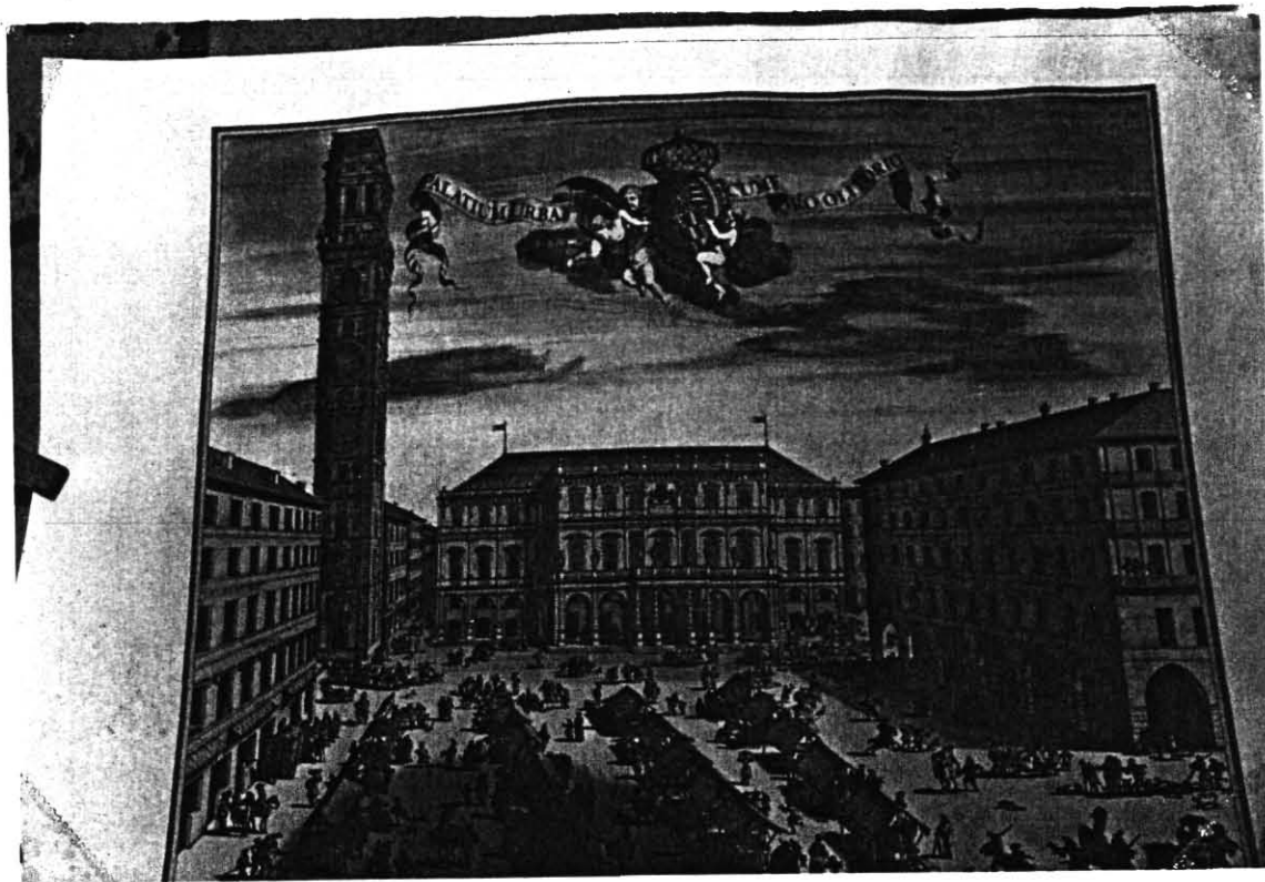
Il Municipio di Torino in una stampa del '700.