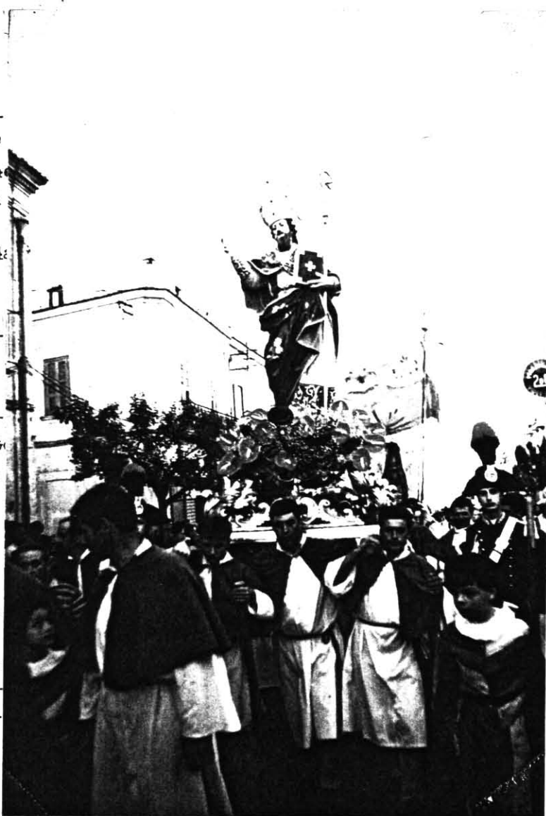
La Statua di San Sabino in Processione.

Ai piedi del palco ascolto con attenzione il suo discorso e non prendo nota di quello che dice perchè sono sicuro che poi me ne darà una copia da poter riportare poi su queste pagine.