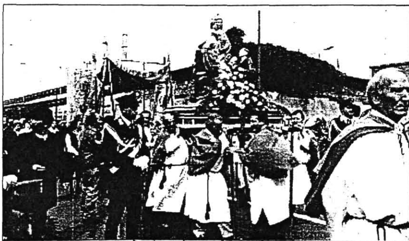
LA PROCESSIONE DELLA MADONNA DELLA FONTANA A TORINO IL 31 MAGGIO 1998