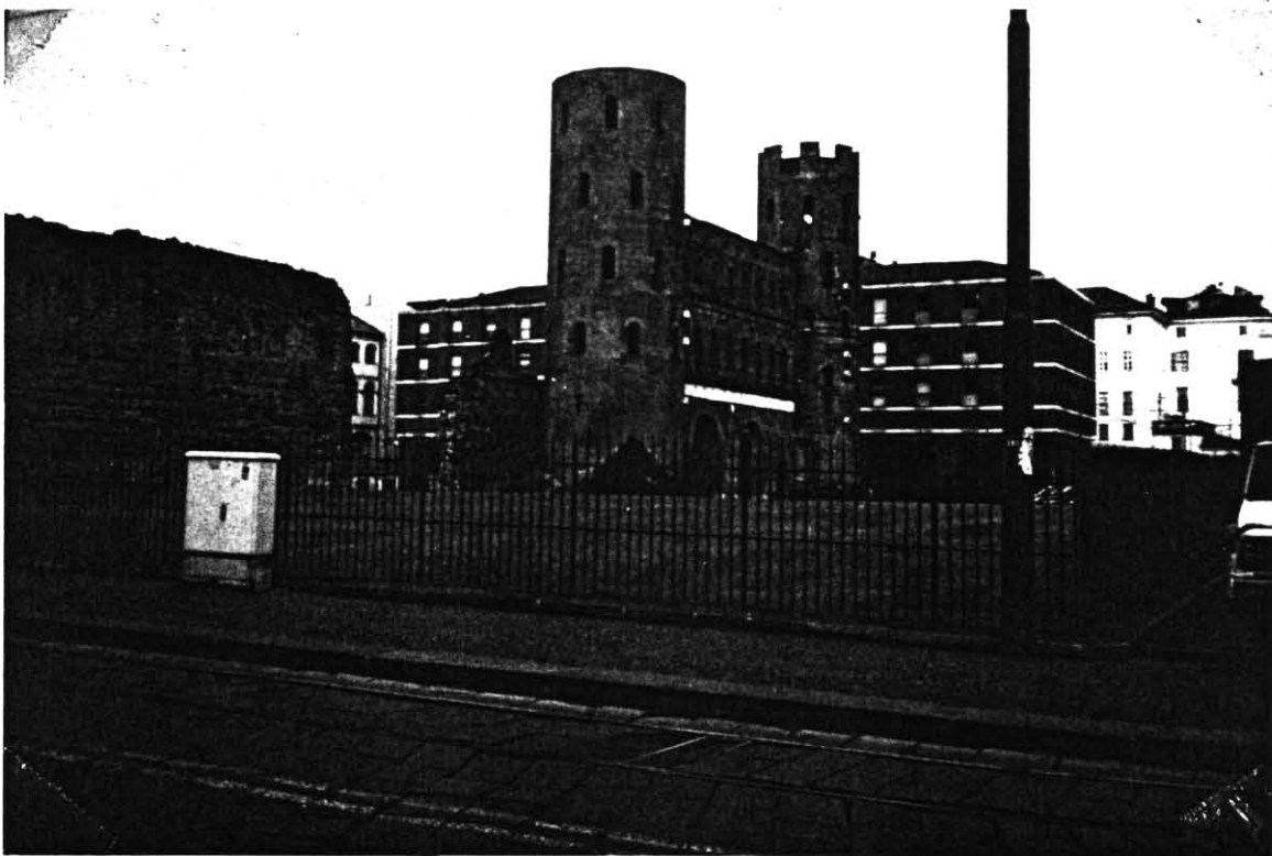
Le due Torri di Porta Palatina al giorno d'oggi.

Ora Porta Palatina ed il prato che la circonda sono protette dalle transenne. Non ci si può avvicinare a piedi ma la sua mole che ricorda le radici di Torino non sfugge all'occhio umano ed all'obiettivo della macchina fotografica.