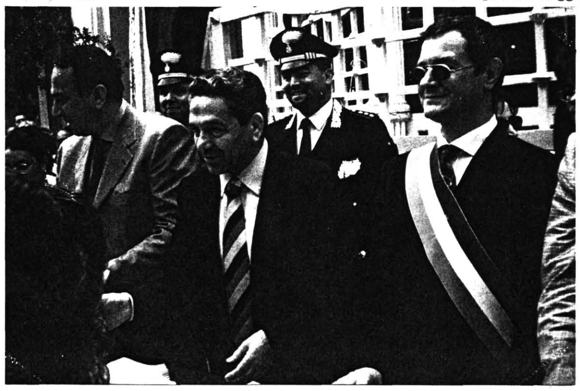
Nella Foto : il Prefetto Benedetto Fusco tra il Questore di Foggia ed il Sindaco di Torremaggiore e davanti al Maresciallo Filardo ed al Capitano Maggi.

Al garabato Servando Carulli con i migliori auguri e salute - Benedetto Fusco Torremaggiore 8-6-98.