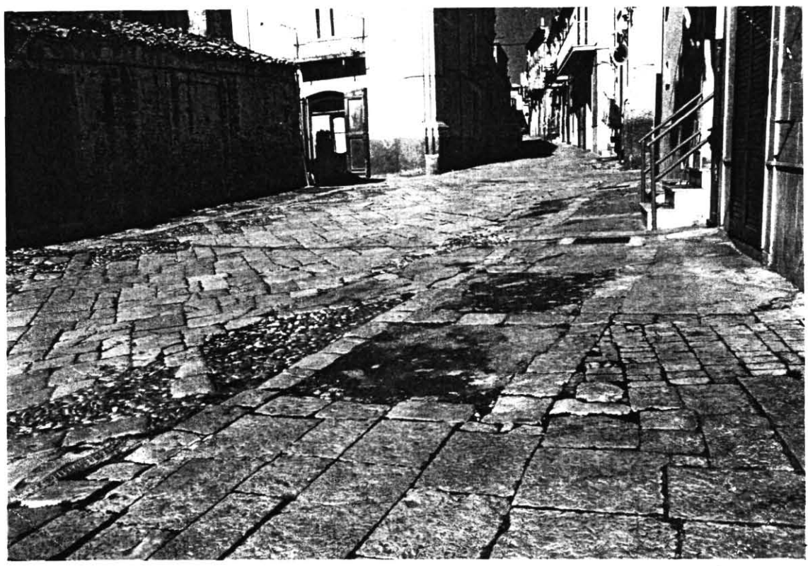
I resti della Piazzetta del Forno Vecchio. Sono ancora visibili le coperture murate di due fosse granarie.

A Torremaggiore l'Albero della Libertà venne piantato dai Repubblicani il dieci febbraio 1799 nella piazzetta antistante il " Forno Vecchio ".