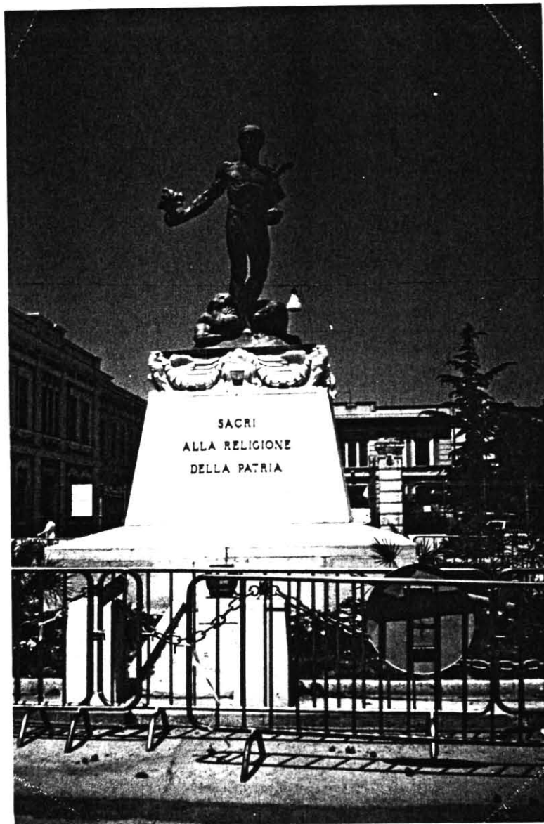
Il Monumento ai Caduti a Torremaggiore. Opera dello Scultore Giacomo Negri. Inaugurato nel 1925.

Quel vasto movimento di pensiero e di azione, noto come "Risorgimento", che portò alla unificazione della Nazione Italiana, dalle nostre parti incominciò molto prima che il Consigliere Comunale Camillo Benso dei Conti di Cavour incitasse i suoi colleghi del Consiglio Comunale di Torino a prodigarsi per l'Unità d'Italia.