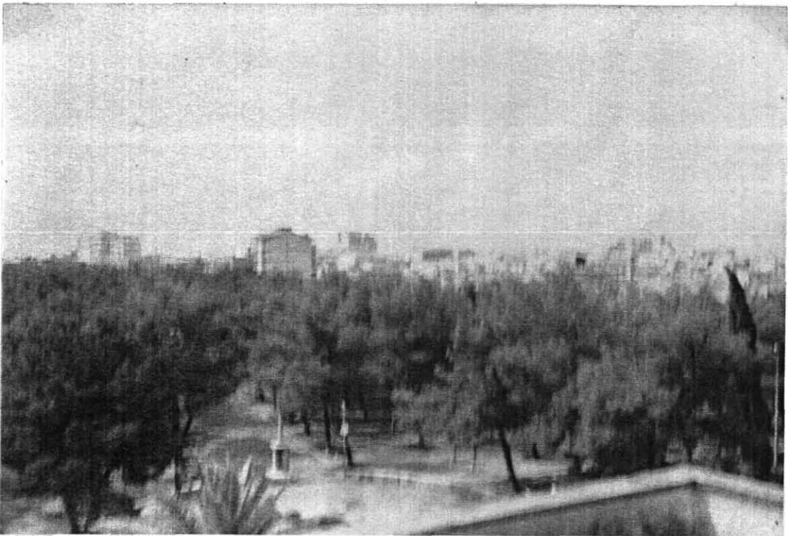
Foto sotto : la stessa area in una fotografia scattata dallo stesso punto nel mese di giugno dell'anno 1983.