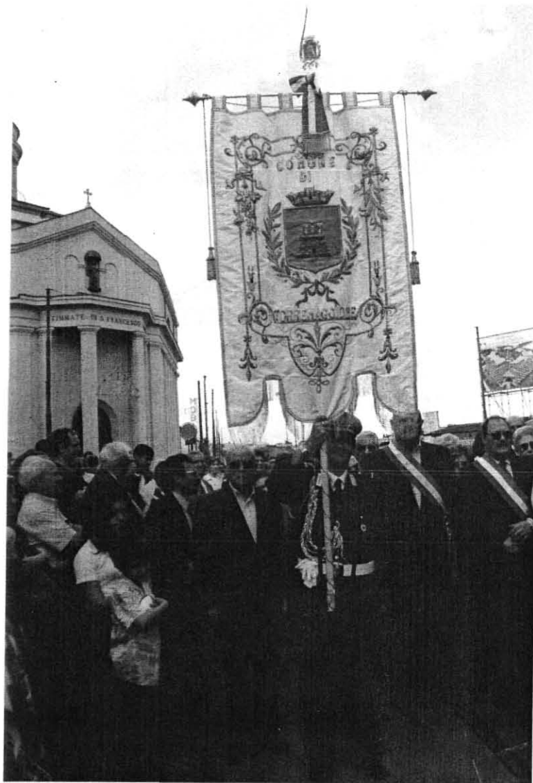
Il Gonfalone del Comune di Torremaggiore e quello dell'Associazione Torremaggiorese di Torino " TRE TORRI ".