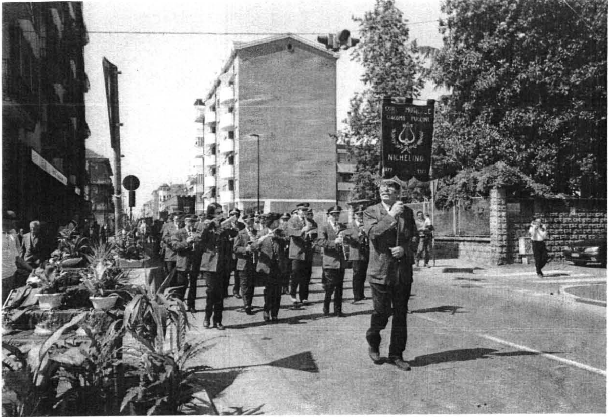
La Banda, il Gonfalone Comunale ed il Sindaco durante la sfilata in via Torino a Nichelino per la celebrazione del quarantesimo anniversario dell'Associazione Volontaria Italianna dei Donatori di Sangue. ( A V I S ).