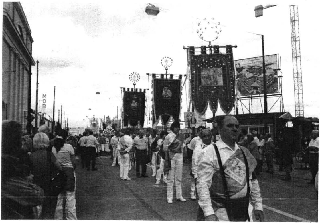
I Gonfaloni delle tre Confraternite invitate alla Festa e il Complesso Bandistico " Giuseppe Verdi " di Venaria Reale.