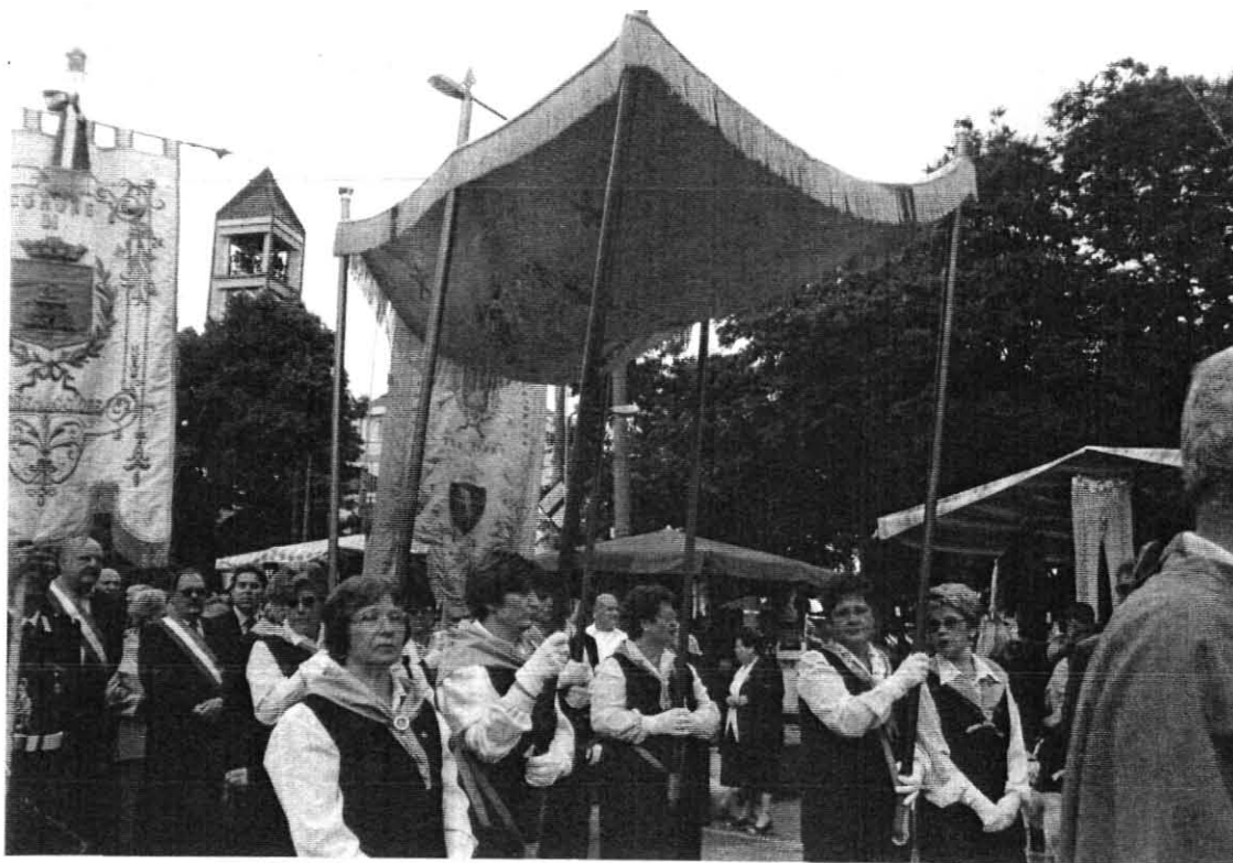
Le " Portantine " del " Paliozzo " e le Coriste salmodianti.