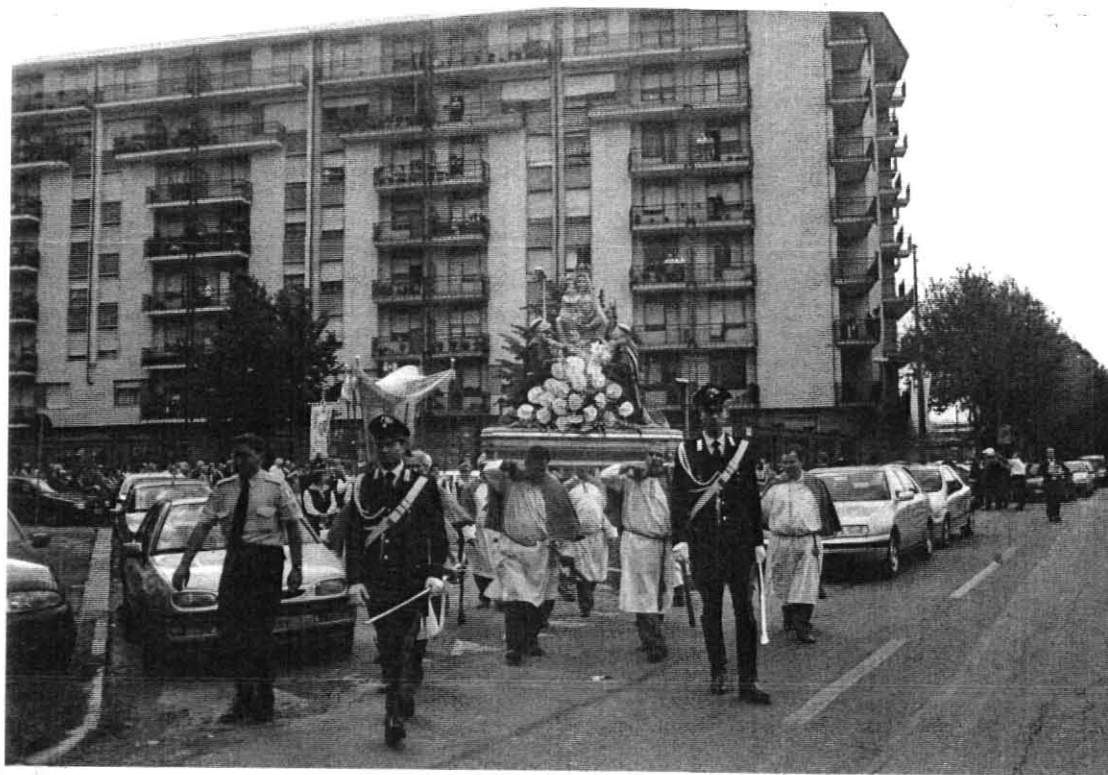
I Carabinieri che fiancheggiano la Statua della Madonna. Sono in tenuta di " Rappresentanza " con stivali, bandoliera, cordoncini e spadone.