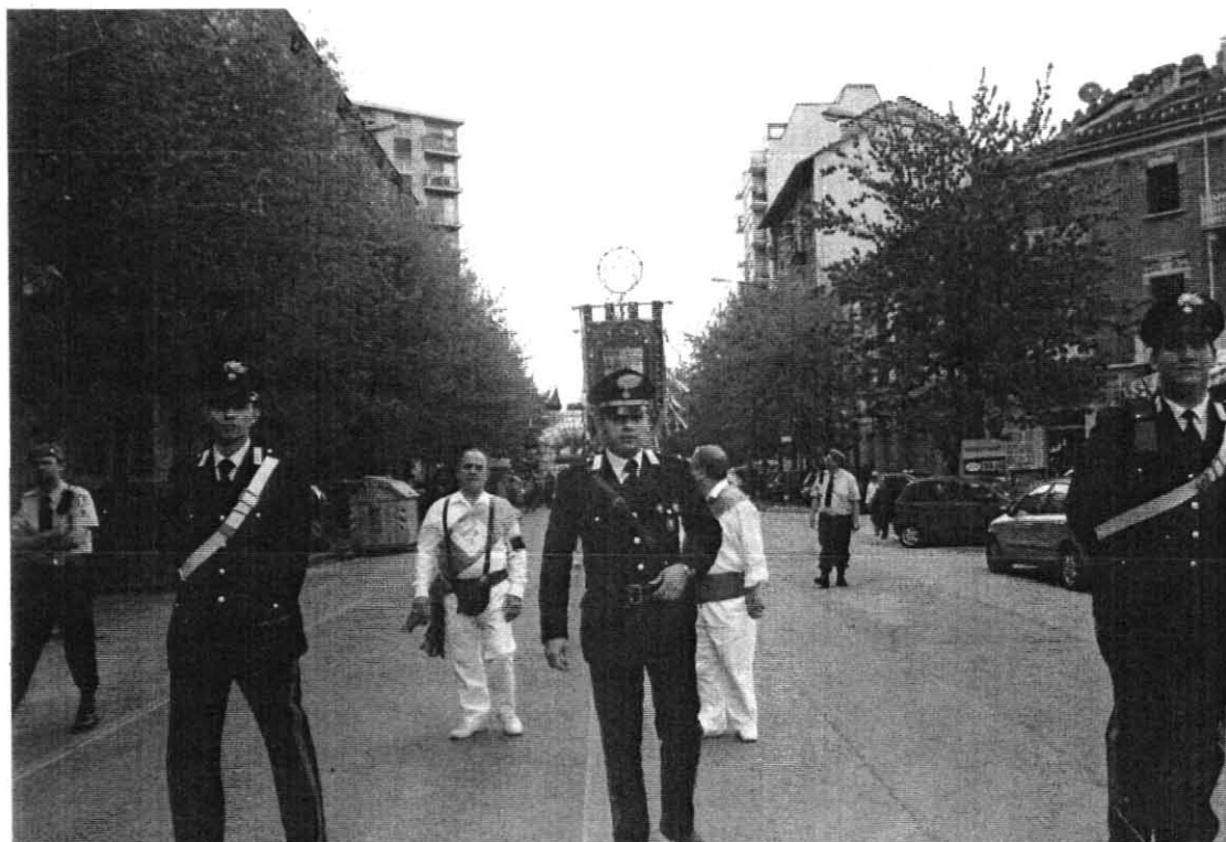
I Carabinieri in servizio d'Ordine Pubblico al seguito della Processione.