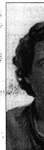
I coniugi Vitto

Quando la g venta un atto lidarietà vers gnosi. Lo scor bre è nata offi «Fondazione tenza Onlu dell'operato d La sua costituz possibile grazie simo gesto del