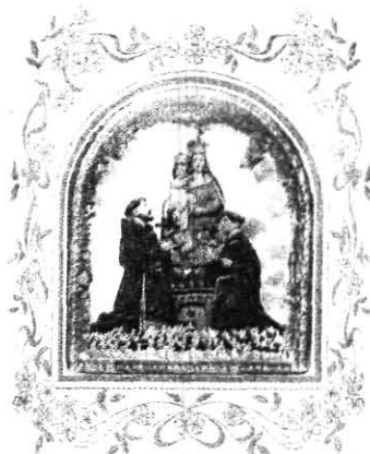
MARIA SS. DELLA FONTANA VENERATA IN TORREMACGIORE

( Torino Maggio 2006- Torremaggiore Maggio 2006-2007 )