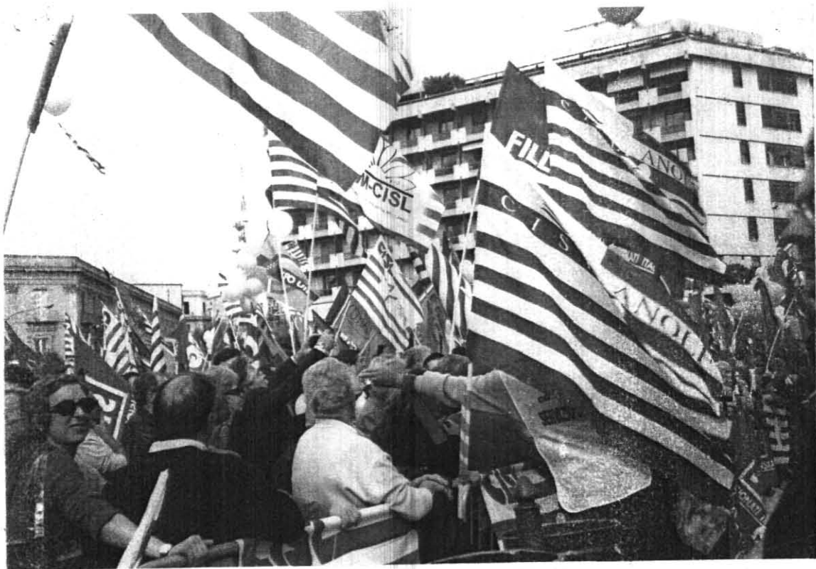
I manifestanti con le loro bandiere sindacali.