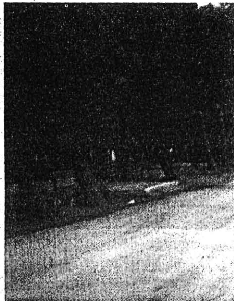
La pineta di Torremaggiore al centro dell'intervento