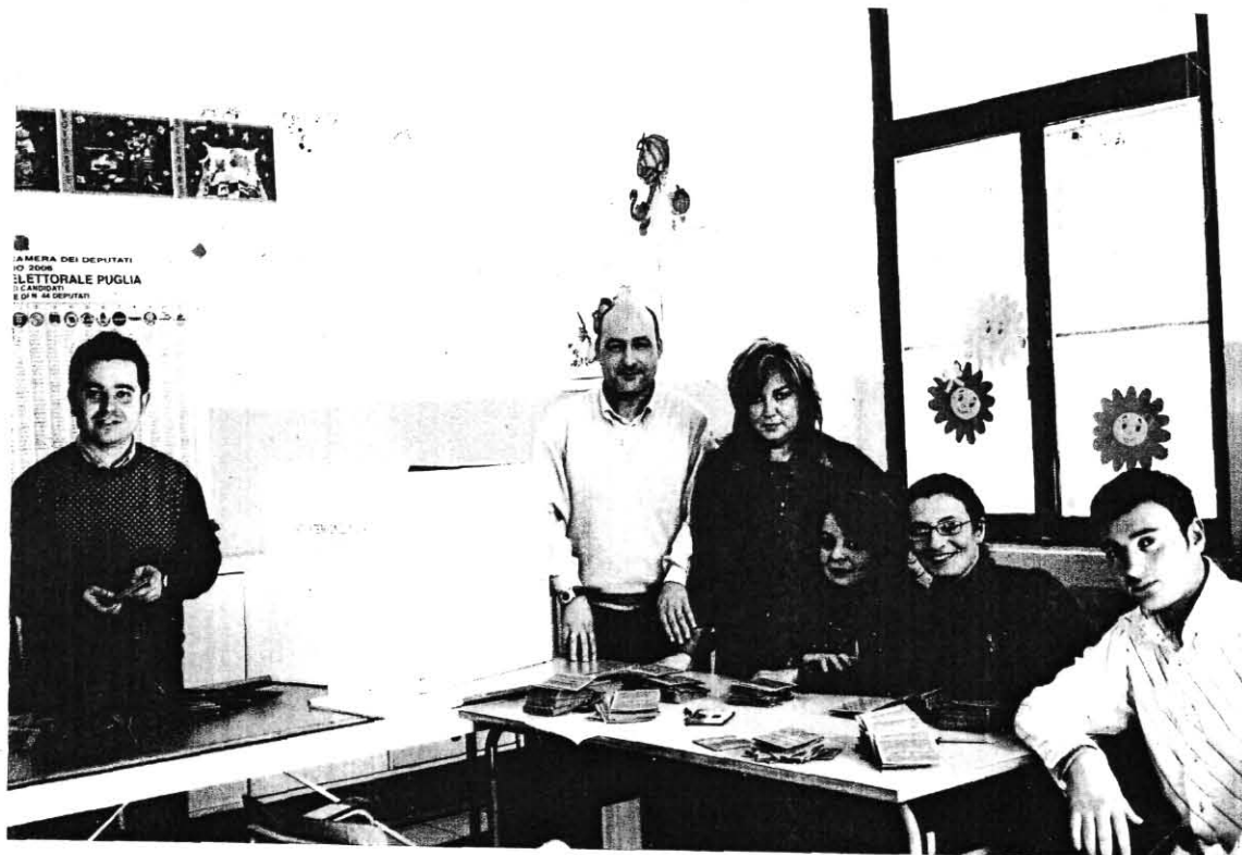
Il Seggio numero Uno e l'impianto elettronico per lo scrutinio.

Un fatto increscioso accade durante le operazioni di scrutinio : una delle Scrutatrici viene colta da malore per cui hanno dovuto intervenire Medici ed autoambulanza. Trasportata all'Ospedale di San Severo la ragazza è stata dimessa qualche ora dopo essere stata ricoverata e curata.