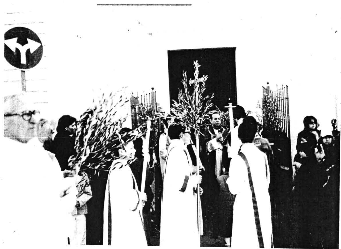
La benedizione delle Palme davanti alla Chiesa di Loreto ( Rito ). Dopo la funzione religiosa mi reco al Seggio.

La mattina dopo è il giorno delle Palme e mi reco con il mio fascio di Palme nella vicina Chiesa del Rito Greco per la loro benedizione.