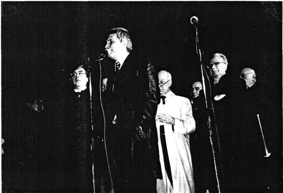
Il Presidente della Regione Puglia Nichi Vendola ed il Segretario Nazionale di Rifondazione Comunista nel loro comizio a Foggia il 24 marzo 2006.

re Fausto Bertinotti mi avvicinò a lui mentre sta parlando Nichi Vendola e gli dico " Compagno Fausto posso stringerti la mano per la quarta volta ? " e lui risponde " Eccola quà ". Poi, dopo che termina il suo discorso aggiungo " Compagno Bertinotti, sono del Paese che ha dato i natali a Sacco che morì assieme a Vanzetti; quando sarai il Presidente della Camera dei Deputati verrai a farci visita ? " e lui risponde " Vedremo " .