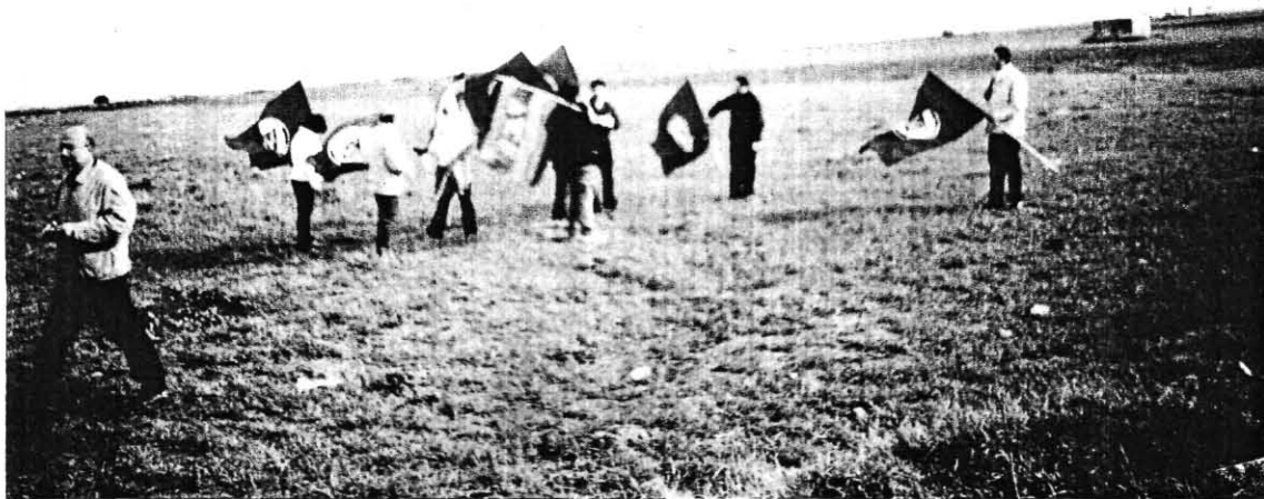
Sit-in di protesta in contrada Ratino .

91 E' da diversi anni che a San Severo ed a Torremaggiore si lotta per impedire la installazione di una centrale termoelettrica in contrada Ratino, in Agro di San Severo al confine con quello di Torremaggiore. Il 29 marzo 2006 Rifondazione Comunista ha organizzato un sit-in di protesta sul luogo in contrada Ratino con il concorso dell'Onorevole Pietro Folena e del Sindaco di San Severo Michele Santarelli.