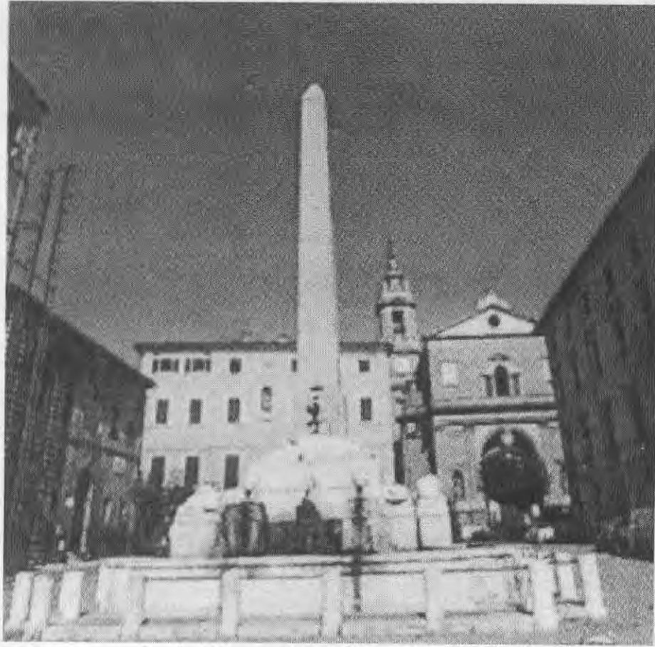
Jesi, Piazza Federico II di Svevia

La Piazza di Jesi dove il 23 dicembre 1194 nacque Federico Secondo di Svevia.