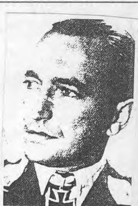
Il Maggiore Rudolf Bohmler.

I tedeschi di quel Battaglione di Paracadutisti restò nella zona fino al pomeriggio di domenica 26 settembre 1943 quando con i loro camions risalirono ordinatamente il Rettifilo tra l'indifferenza generale di coloro che a quell'ora stavano passeggiando.