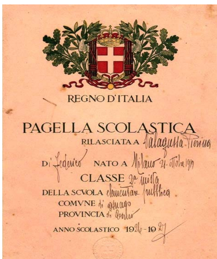
Pagella del 1927, non è cambiato poi molto.

Dall'anno scolastico 2012-2013 tutte le scuole italiane offriranno la pagella online . I primi esperimenti ufficiali cominceranno a settembre. È un'iniziativa dei ministri Brunetta e Calderoli, varata lo scorso 9 giugno.